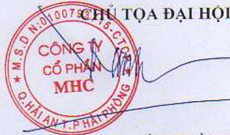
ĐẶNG TIÊN THÀNH